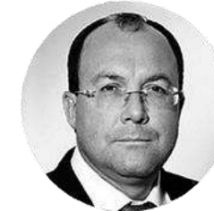
ОЛЕГ ПЕТРОВИЧ САФОНОВ

Директор Департамента развития фармацевтической и медицинской промышленности Минпромторга РФ