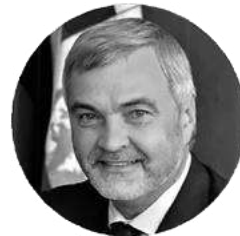
ВЛАДИМИР ВИКТОРОВИЧ УЙБА

Руководитель Федерального медико-биологического агентства