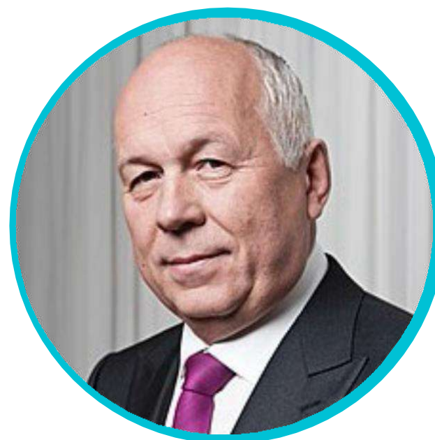
Генеральный директор госкорпорации «Ростех»