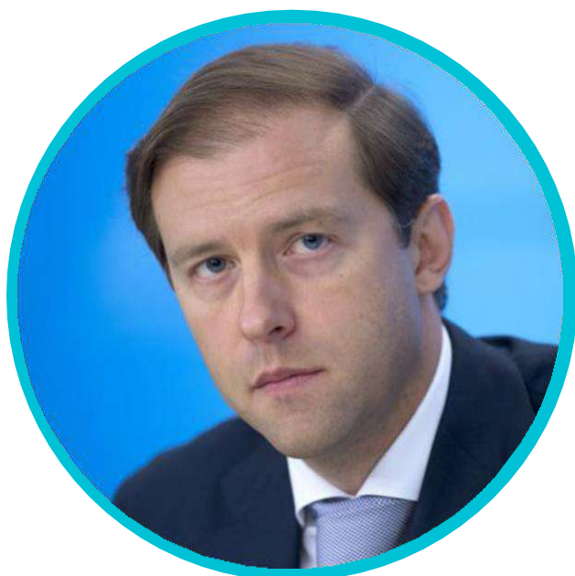
Министр промышленности и торговли Российской Федерации