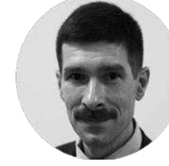
ИГОРЬ ВИКТОРОВИЧ КОРОБКО

Директор Департамент лекарственного обеспечения и регулирования обращения медицинских изделий Министерства Здравоохранения РФ