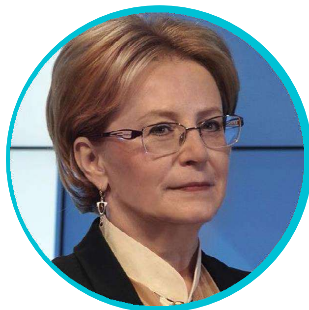
Министр здравоохранения Российской Федерации