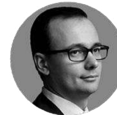
АЛЕКСЕЙ ВИКТОРОВИЧ АЛЕХИН

Руководитель Федерального медико-биологического агентства