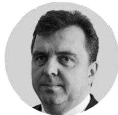
СЕРГЕЙ АНАТОЛЬЕВИЧ ЦЫБ

Заместитель министра промышленности и торговли РФ