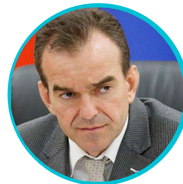
Губернатор Краснодарского края